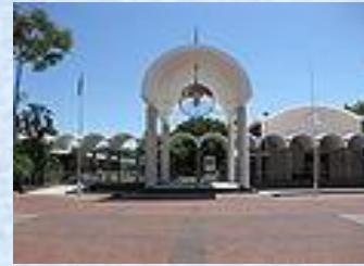
Parliament of Botswana