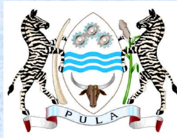
REPUBLIC OF BOTSWANA