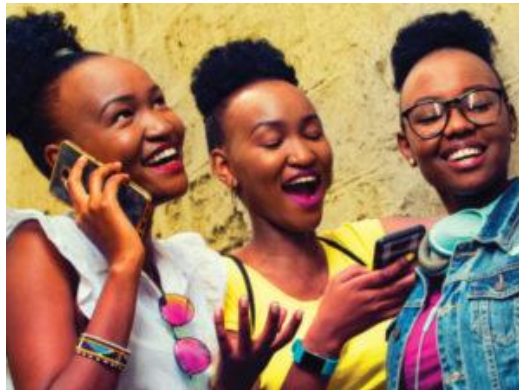
Telkom Kenya hits 4 million subscribers in six months.

Telkom Kenya has announced that its subscriber base has increased by one million and reached 4 million subscribers in six months. To celebrate this, the telecommunications firm launched a promotion to reward 50 subscribers with a Toyota Belta.