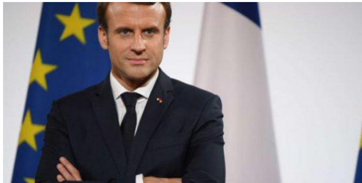
Le président français Emmanuel Macron au palais de l'Élysée, le 21 décembre 2017

Favoriser les aides bilatérales, augmenter les dons, réserver une part importante des fonds au Sahel... La feuille de route du gouvernement français concernant l'aide publique au développement accorde plus de place à l'Afrique. Une nouvelle stratégie qui ne fait pas l'unanimité auprès des ONG.