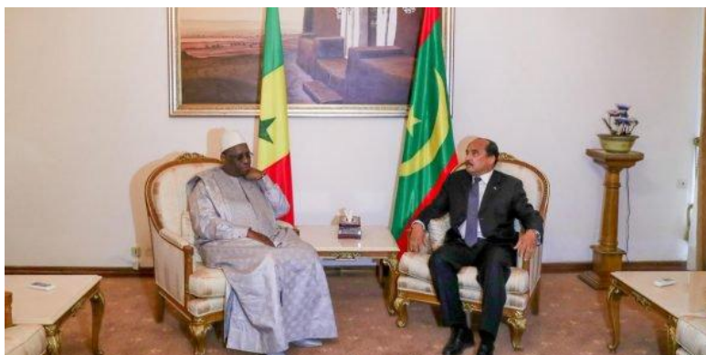
Les chefs d'États Macky Sall et Mohamed Ould Abdel Aziz à Nouakchott le 9 février 2018.

L'accord signé le 9 février entre la Mauritanie et le Sénégal permettra l'exploitation du gisement gazier offshore commun « Grand Tortue-Ahmeyim » (GTA) de 450 milliards de mètres cubes à partir de 2021.