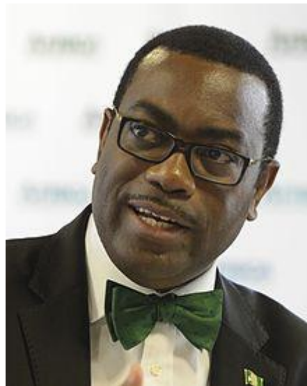
Akinwumi A. Adesina

Over the past few years, the African Development Bank (AfDB) has confirmed its position as Africa's premier development finance institution, generating significant impact on the continent's economic and social development.